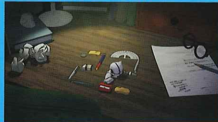
第21回インディーズアニメフェスタ グランプリ受賞者 狐日和