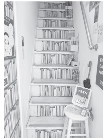
◀ この楽しい階段が「点滴堂」さんの入り口。

三鷹駅北口から徒歩 5 分の所にある「点滴堂」さんは昨年の 3 月にオープンしたばかりの古本カフェ&ギャラリーです。ワンダリングを注文すると本棚の本を持って来て自由に読むことができます。またお店にある本は全て購入することが可能です。