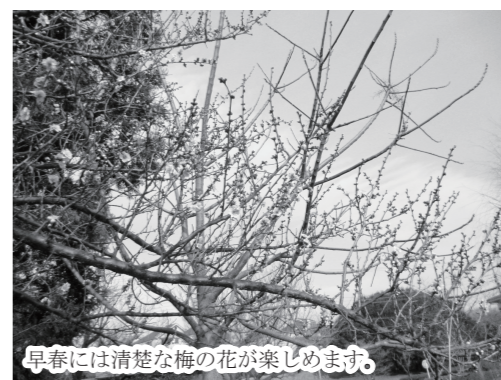
早春には清楚な梅の花が楽しめます。