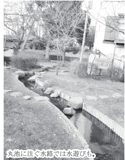
丸池に注ぐ水路では水遊びも。