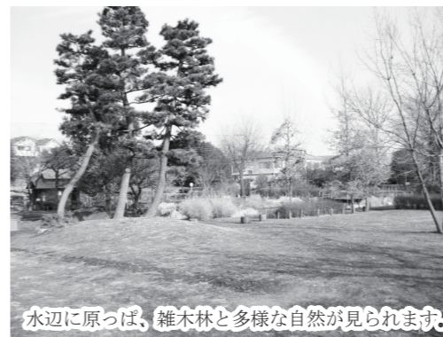
水辺に原っぱ、雑木林と多様な自然が見られます。