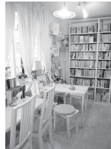
◀ 広い窓のある空間がとても心地がいい。