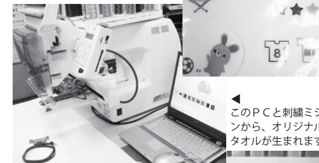
このPCと刺繍ミシンから、オリジナルタオルが生まれます。